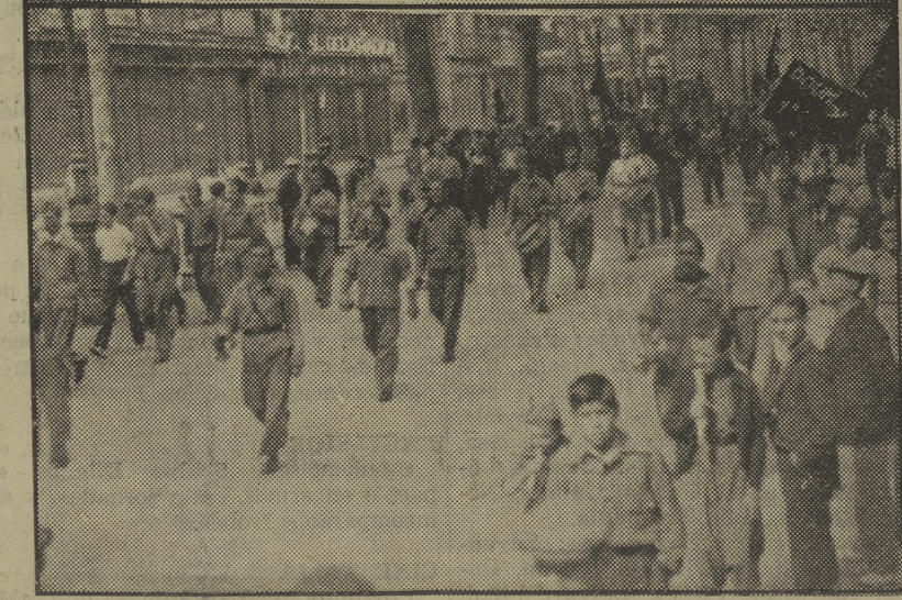
Los bravos milicianos del P. O. U. M., que conquistaron Monte Aragón y Estrecho Quinto, desfilan por las Ramblas, precedidos por la banda.

filas y marchaba al lado de un miliciano. En los asaltos, la bandera desplegada de la primera centuria. Un gran rasgado en un extremo, causado por la