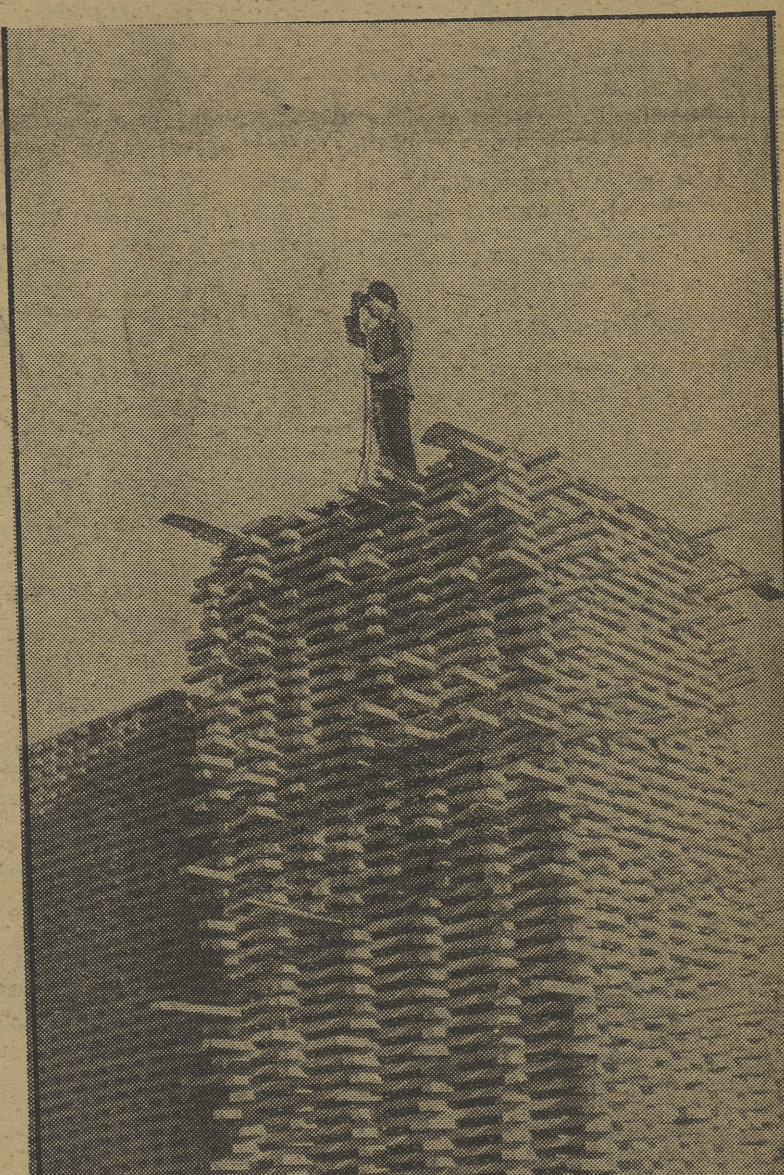
Este mozo del pueblo de Pegerinos, armado de fusil, vigila atenta y cuidadosamente desde lo alto de las pilas de madera el movimiento del enemigo que acusa una retirada sorprendente