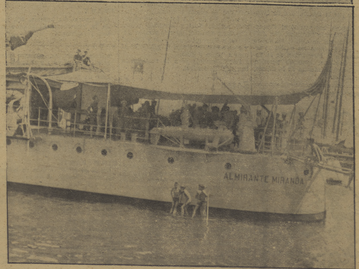
Los valientes marinos del «Almirante Miranda» despliegan la roja bandera que les ofreció el P. O. U. M., algunos miembros del Comité Ejecutivo del cual aparecen en la foto junto con los componentes del Comité de a bordo del buque rojo