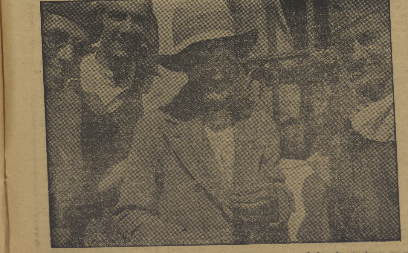
Un campesino de Gelsa al que los fascistas le mataron su pollino y al que una de las columnas obreras que operan en Aragón le ha entregado el dinero necesario para adquirir otro