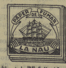
Libret de 75 fulls 10 cts.