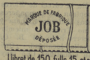
Libret de 150 fulls 15 cts.