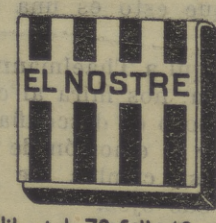
Libret de 70 fulls 10 cts.

Tres marques de qualitat insuperable. Tamany i formats per a tots els gustos i conveniencies. AMICS FUMADORS!! ADOPTEU-LES! ACONSELLEU-LES!!