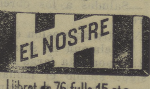
Libret de 76 fulls 15 cts.