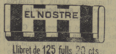
Libret de 125 fulls 20 cts.