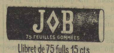
Libret de 75 fulls 15 cts.