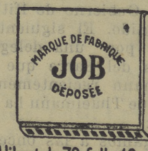
Libret de 70 fulls 10 cts.