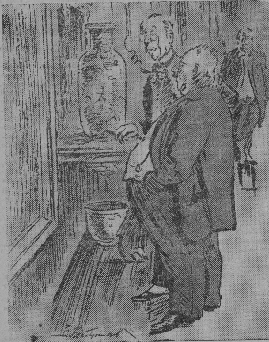
En casa del nuevo rico

Un visitante.—Y ese cuadro que dice usted que han comprado es un Velázquez o un Murillo?