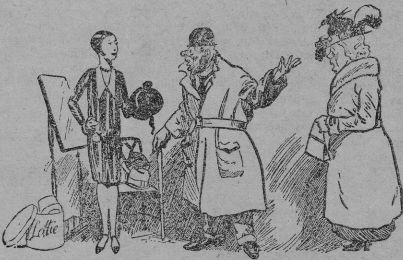
En casa de la sombrerera.

A bordo del vapor-correo de Barcelona han llegado esta mañana los Catedráticos que forman el Tribunal que ha de examinar a los alumnos de la Sección de Letras del Bachillerato universitario.