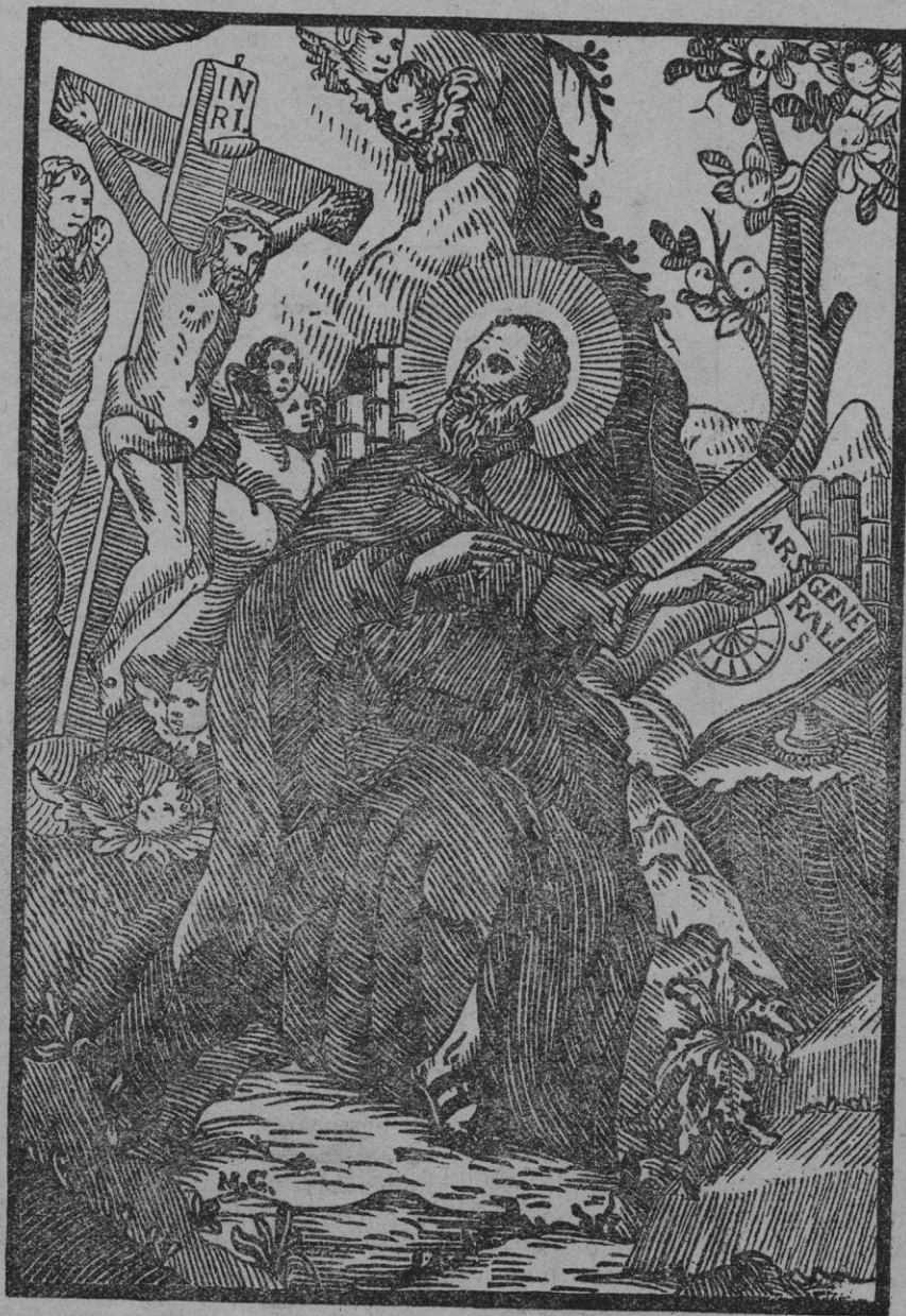
Imagen del Beato Ramón Lull (Antiguo grabado en boj de la Imprenta Guasp)

Patria del gran misionero Ramón Lull —tan enaltecido recientemente por el Papa—, debe Mallorca poner especial empeño en la magna empresa. Afortunadamente, no faltan aquí celosos propagandistas de ésta en sus diferentes actividades, como lo prueban las frecuentes reseñas de alentadores actos misionales que registramos. Crezca con el favor de Dios el entusiasmo, que el día en que no sean algunos, sino muchos, los convencidos, no cabe duda que la colaboración mallorquina será digna, por su generosidad y magnitud, de la fe ardiente de nuestro pueblo, que nunca ha rehusado su amorosa respuesta a las solícitas direcciones de la Iglesia.