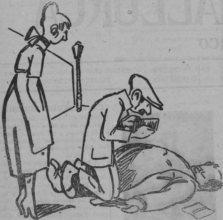
Después del asesinato

La cómplice.—¿Qué dice en ese papel que hay en la cartera? El asesino.—¡Que se marchaba al río con propósito de suicidarse por falta de recursos!