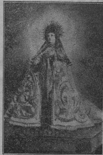
Imagen de Santa Teresa que se venera en la misma iglesia.

plicado han tenido que vencer con tiempo, constancia y talento, las enormes dificultades que lleva en sí. P. B.