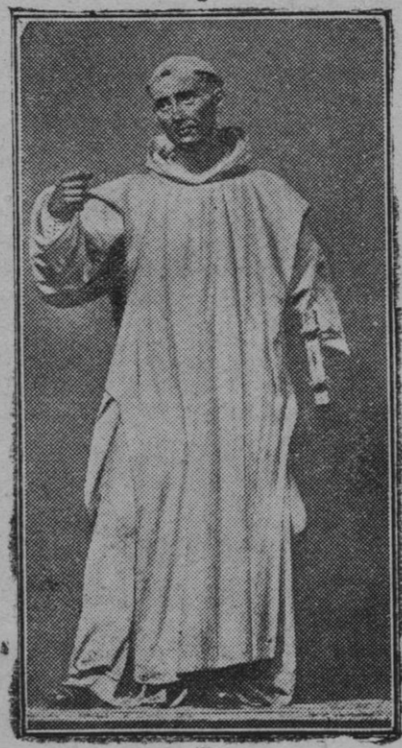
San Bruno (Escultura de Juan M. Montañés.—Museo de Sevilla.)

Y finalmente «El Rey de los vaqueiros», cómica en dos partes.