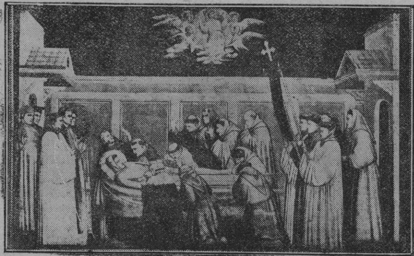
La muerte de San Francisco de Asís (Giotto-Iglesia de Santa Cruz, Florencia)

VIDA DE JESUCRISTO.—P. AVAN CINI.—(Meditaciones para todos los días del año).—Un tomo de más de 500 páginas en tela negra.—Ptas. 3'00. De venta: Imprenta «LA ESPERANZA»