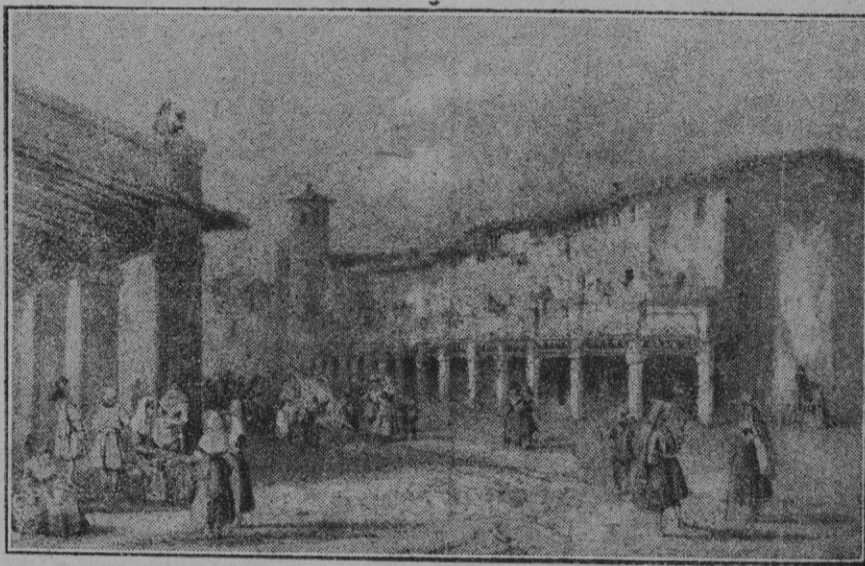
Del libro Souvenirs d'un voyage d'art a l'île de Majorque , por J. B. Laurens (1840). Plaza de San Antonio. Al fondo se ve la iglesia de San Antonio de Padua, que fué derruida a raíz del derribo de las murallas.