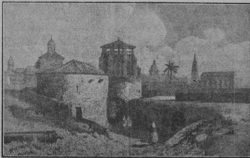
Vista tomada desde la antigua muralla. En ella se ve la histórica Puerta de Santa Margarita, que era merecedora de ser conservada y que de tan deplorable manera fué derruida.