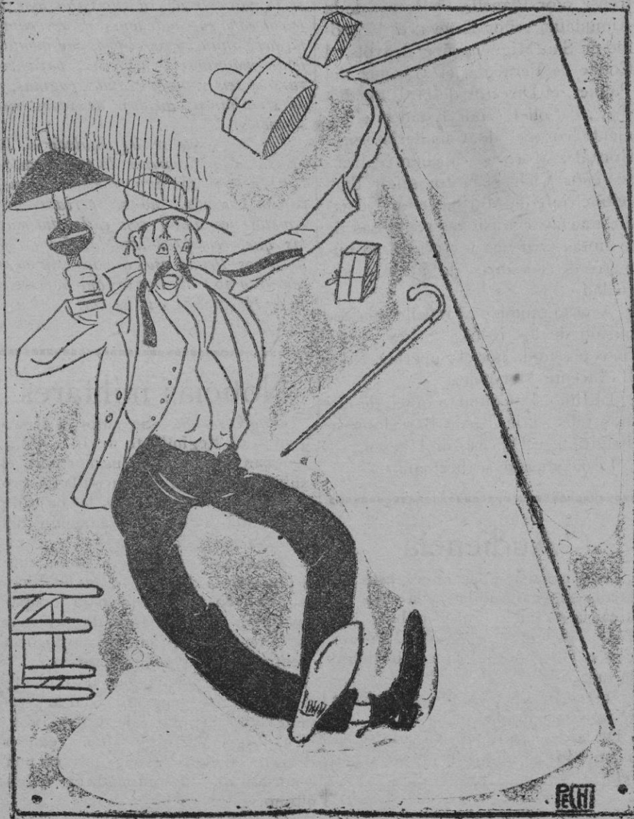
—El borracho.—Entrando así, callandito, mi mujer no me sentirá llegar.

De venta: Imprenta «La Esperanza», Lonjeta, 11 y 13.