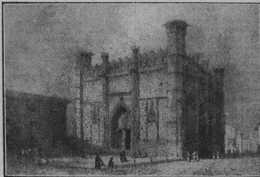
Del libro Souvenirs d'un voyage d'art a l'île de Majorque. La Lonja; sobre los torreones angulares se ve el tejadillo que los cubría y que acertadamente fué suprimido. Junto al bello edificio, el desaparecido cuartel de Atarazanas.