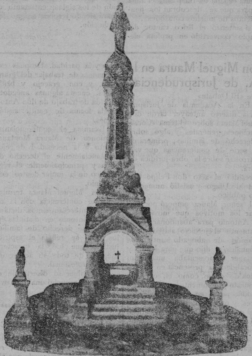
Maqueta del monumento a Cristo-Rey que se ha de levantar en el mirador del santuario de Nuestra Señora de San Salvador (Felanitx). El proyecto es obra del esultor D. Tomás Vila.