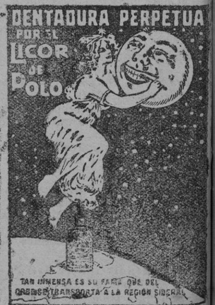
TAN INMENSAS SU PASO QUE DEL OMBRO TRANSPORTA A LA REGION SICILIA

Palma Santiago Rosillo 25, frente al Instituto.