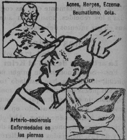
Acnes, Herpes, Eczema, Reumatismo, Gota.

Segundo piso, 100 ptas. mensuales. Razón: Centro Anuncios.