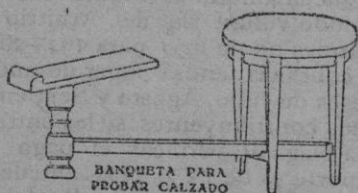
BANQUETA PARA PROBAR CALZADO

NOYA.—Todos mis artículos son fabricados en maderas de primera calidad