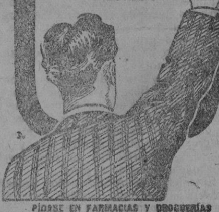
PIÑESE EN FARMACIAS Y DROGUERIAS

u los Médicos le llaman el REMEDIO DE LOS DÉBILES