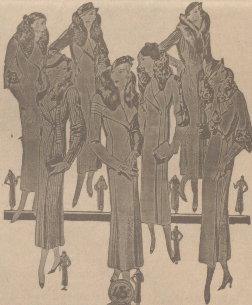
Abrigos señora, modelos novedad, a 20, 25, 30, 40, 50 y 60 pesetas. Abrigos para niñas, de 10, 12, 15 y 20 pts. LA CASA MAS SURTIDA Y MAS BARATO VENDE

Plaza Mayor, 48 y Lain Calvo, 9 Sucursal: Plaza Mayor, 5 BURGOS Primera casa en confecciones para caballero, señora, jóvenes y niños. Tejidos, Pañería y Sastrería