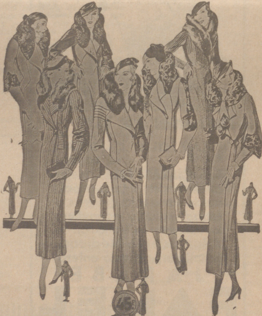
Abrigos señora, modelos novedad, a 20, 25, 30, 40, 50 y 60 pesetas. Abrigos para niñas, de 10, 12, 15 y 20 ptas. LA CASA MAS SURTIDA Y MAS BARATO VENDE

Plaza Mayor, 48 y Lain Calvo, 9 Sucursal: Plaza Mayor, 5 BURGOS Primera casa en confecciones para caballero, señora, jóvenes y niños. Tejidos, Pañería y Sastrería