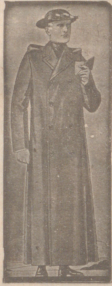
Guardapolvos de dril, a 20, 22 y 25 pesetas.