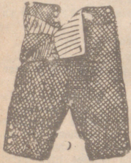
Pantalones niño, de 5 a 10 años Paño dril o pana.

Primera casa en confecciones para caballero, señora jóvenes y niños. Tejidos, Pañería y Sastrería