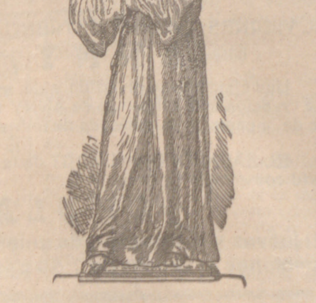
Cómo el cordón franciscano ceñirá y salvará al mundo.

Es la «nueva» barbarie la que se muestra cada día más desatada, perpetrando toda suerte de enormes delitos, algunos de los cuales, los históricos bárbaros no consumaron siquiera por instinto de conservación. Vamos a citar un hecho que prueba hasta la saciedad cómo la barbarie actual llega donde la barbarie de todos los siglos no llegó. En los días últimos, en la provincia de Vizcaya han abrasado nada menos que MEDIO MILLON de pinos, dando fuego a los montes por diversos lugares e intencionadamente. Estos montes son propiedad de la provincia. ¿Puede darse cosa más bárbara, más disparatada, nociva y criminal que destruir por destruir, haciendo desaparecer, en poquísimo tiempo, una riqueza enorme que necesita los esfuerzos y cuidados y sacrificios de generaciones de hombres y siglos para ser creada? Con ello se producen males sin cuento en la riqueza, en la salubridad pública, en el clima, en la agricultura y ganadería, en la belleza de las regiones, y quienes más padecen son las clases menesterosas. La corrupción de las almas por cuanto pasa a la inteligencia en libros, folletos, periódicos malsanos, pro-