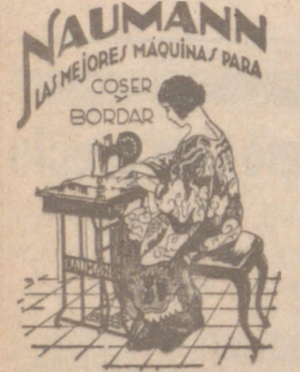
Máquinas coser NAUMANN. Bobina central. Precios más barato que nadie.