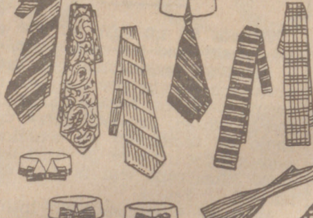
Quantos blancos, de 1'25, 1'50 y 2 pesetas.