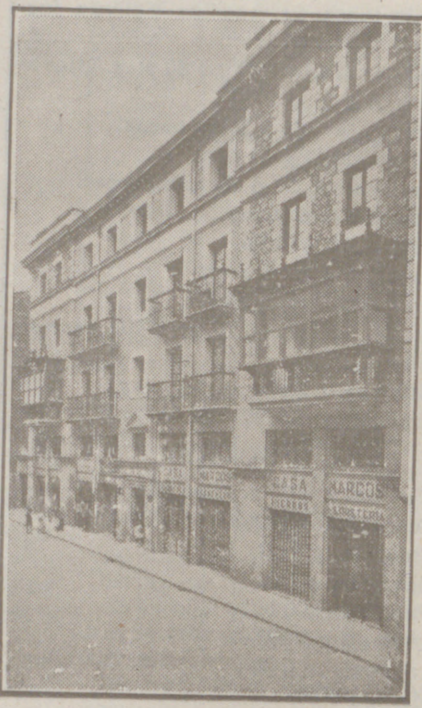
Fachada, por la calle de la Moneda números 16 y 17, de la CASA SOCIAL propiedad de la Federación Burgalesa de Sindicatos Agrícolas Católicos.

Se hallan establecidas en su planta baja las Oficinas y talleres de máquinas de «El Castellano» y «El Defensor de los Labradores»