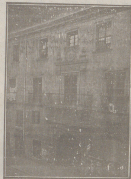
Entrada a las Oficinas de la Federación y MUTUALIDAD AGRÍCOLA BURGALESA. Calle de Santander, números 10, 12 y 14, Burgos.

Un accidente en vuestros obreros, criados, pastores o en vosotros mismos, puede causar grave daño económico o la ruina en vuestra casa.