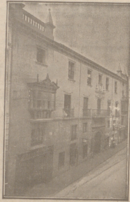
Fachada, por la calle de Santander, 10, 12 y 14, de la CASA SOCIAL propiedad de la Federación Burgalesa de Sindicatos Agrícolas Católicos.

Paseo de los Vadillos, 16 - Teléfono, 452-R - BURGOS