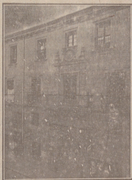
Entrada a las Oficinas de la Federación y MUTUALIDAD AGRÍCOLA BURGALESA. Calle de Santander, números 10, 12 y 14, Burgos.

En ella están las Oficinas de la FEDERACIÓN, CAJA DE AHORROS, MUTUALIDAD AGRÍCOLA BURGALESA y Redacción y Administración de «El Castellano» y «El Defensor de los Labradores»