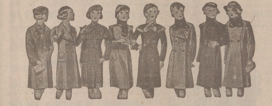
ABRIGOS PARA NIÑAS — MODELOS NOVEDAD, de 15, 18, 20, 25, 30 y 40 pesetas.

Primera casa en confecciones para caballero, señora, jóvenes y niños. — Tejidos, Pañería y Sastrefía.