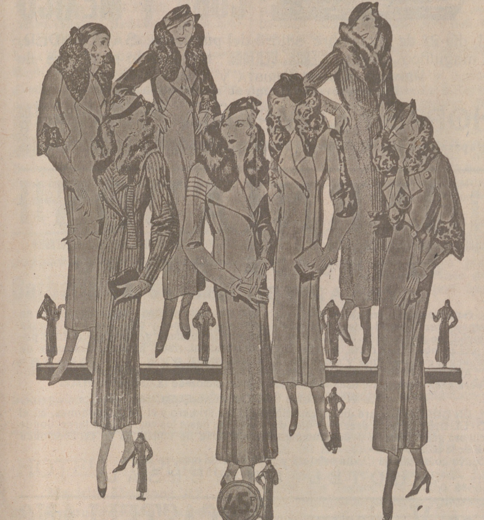
50 Modelos distintos en Abrigos Gamuzas NOVEDAD.—Modelos, creación Parísien a 25, 30, 40, 50, 60, 70, 80 y 100 pesetas