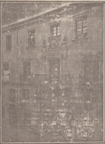
Entrada a las Oficinas de la Federación y MUTUALIDAD AGRÍCOLA BURGALESA. Calle de Santander, números 10, 12 y 14. Burgos.

En ella están las Oficinas de la FEDERACIÓN, CAJA DE AHORROS, MUTUALIDAD AGRÍCOLA BURGALESA y Redacción y Administración de «El Castellano» y «El Defensor de los Labradores»