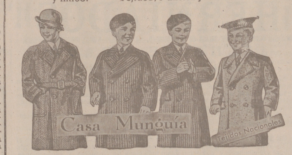
Gabanes para niños modelos últimos, de 18 a 60 pesetas

Primera casa en confecciones para caballero, señora, jóvenes y niños. — Tejidos, Pañería y Sastrefía.