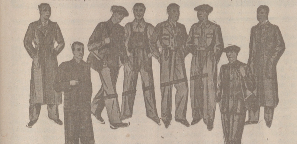
Guardapolvos, de 8 a 20 pesetas. Pellizas, de 18 a 125 pesetas Buzos, de 7 a 25 pesetas. Pantalón firante, de 7 a 12 pesetas

«Hamburg-América Linie» Servicio rápido de pasaje y carga para CUBA Y MEXICO