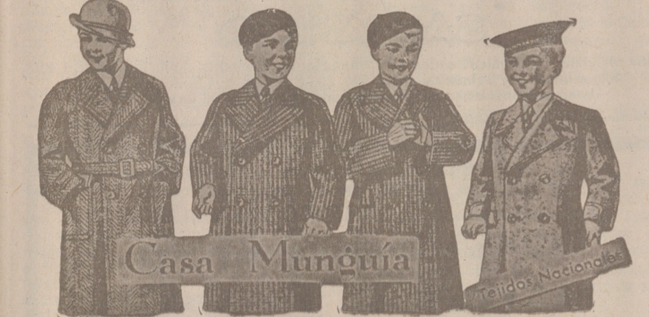
Cabanes para niños modelos últimos, de 18 a 60 pesetas

Casa Munguía Plaza Mayor 42 y Lain Calvo 9 Sucursal: Plaza Mayor, 5 BURGOS Primera casa en confecciones para caballero, señora, jóvenes y niños. — Tejidos, Pañería y Sastrería.