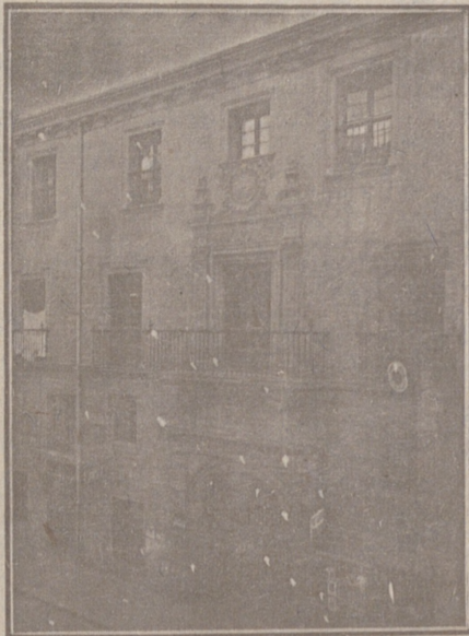
Entrada a las Oficinas de la Federación y MUTUALIDAD AGRÍCOLA BURGALESA. Calle de Santander, números 10, 12 y 14. Burgos.

En ella están las Oficinas de la FEDERACIÓN, CAJA DE AHORROS, MUTUALIDAD AGRÍCOLA BURGALESA y Redacción y Administración de «El Castellano» y «El Defensor de los Labradores»