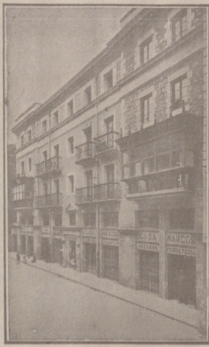
Fachada, por la calle de la Moneda, números 15 y 17, de la CASA SOCIAL propiedad de la Federación Burgalesa de Sindicatos Agrícolas Católicos.

Se hallan establecidas en su planta baja las Oficinas y talleres de máquinas de «El Castellano» y «El Defensor de los Labradores»