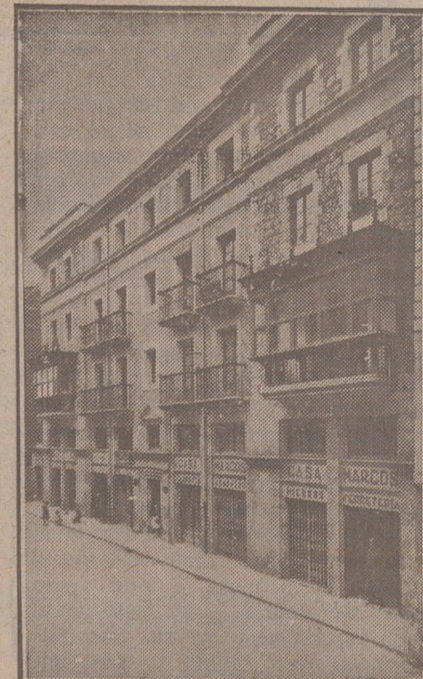
Fachada, por la calle de la Moneda, números 15 y 17, de la CASA SOCIAL propiedad de la Federación Burgalesa de Sindicatos Agrícolas Católicos.

Se hallan establecidas en su planta baja las Oficinas y talleres de máquinas de «El Castellano» y «El Defensor de los Labradores»