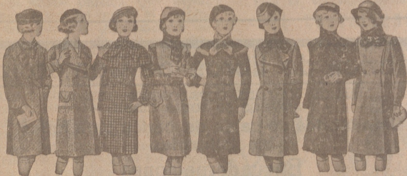
ABRIGOS PARA NIÑAS — MODELOS NOVEDAD, de 15, 18, 20, 25, 50 y 40 pesetas.

Casa Munguía Plaza Mayor 42 y Lala Calvo 9 Sucursal: Plaza Mayor, 5 BURGOS Primera casa en confecciones para caballero, señora, jóvenes y niños. — Tejidos, Pañería y Sastrefía.