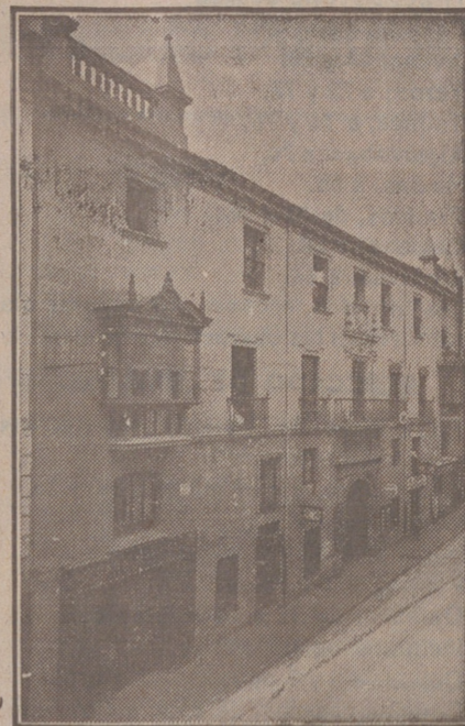
Fachada, por la calle de Santander, 10, 12 y 14, de la CASA SOCIAL propiedad de la Federación Burgalesa de Sindicatos Agrícolas Católicos.

Oficinas: (Casa de la Federación): Calle de Santander, 10 y 12 Burgos