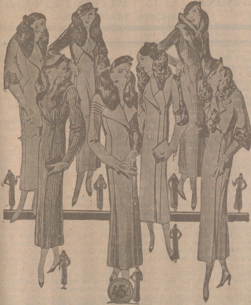
50 Modelos distintos en Abrigos Gamuzas NOVEDAD.—Modelos, creación Parísíen a 25, 30, 40, 50, 60, 70, 80 y 100 pesetas