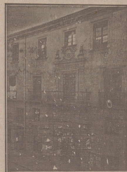
Entrada a las Oficinas de la Federación y MUTUALIDAD AGRÍCOLA BURGALESA. Calle de Santander, números 10, 12 y 14. Burgos.