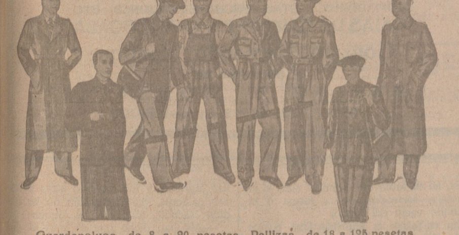
Guardapolvos, de 8 a 20 pesetas. Pellizás, de 18 a 125 pesetas. Buzos, de 7 a 25 pesetas. Pantalón tirantes, de 7 a 12 pesetas