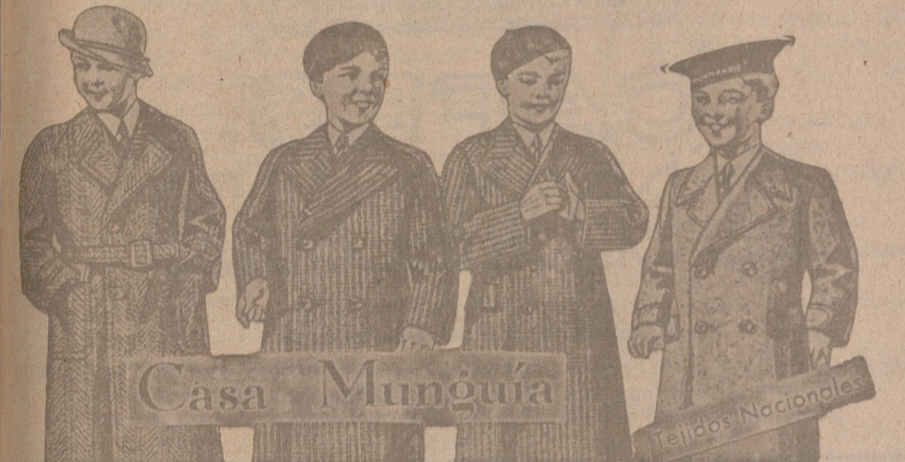
Gabanes para niños modelos últimos, de 18 a 60 pesetas

Primera casa en confecciones para caballero, señora, jóvenes y niños. — Tejidos, Pañería y Sastrería.