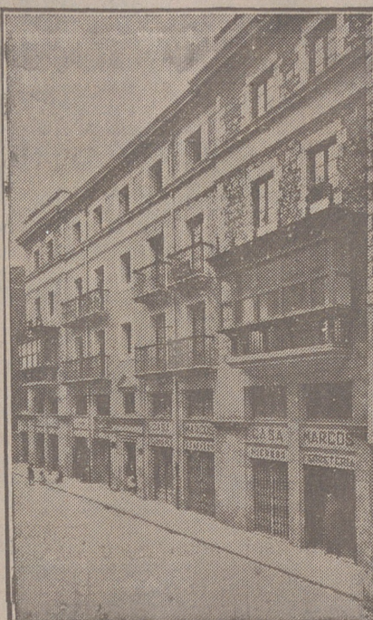
Fachada, por la calle de la Moneda, números 15 y 17, de la CASA SOCIAL propiedad de la Federación Burgalesa de Sindicatos Agrícolas Católicos.

No confundirse: Calle de Santander, (Casa de la Federación) - Burgos