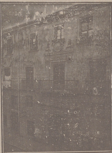
Entrada a las Oficinas de la Federación y MUTUALIDAD AGRÍCOLA BURGALESA. Calle de Santander, números 10, 12 y 14. Burgos.

Un accidente en vuestros obreros, criados, pastores o en vosotros mismos, puede causar grave daño económico o la ruina en vuestra casa.