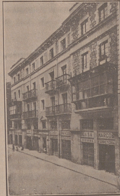
Fachada, por la calle de la Moneda, números 15 y 17, de la CASA SOCIAL propiedad de la Federación Burgalesa de Sindicatos Agrícolas Católicos.

Se hallan establecidas en su planta baja las Oficinas y talleres de máquinas de «El Castellano» y «El Defensor de los Labradores»