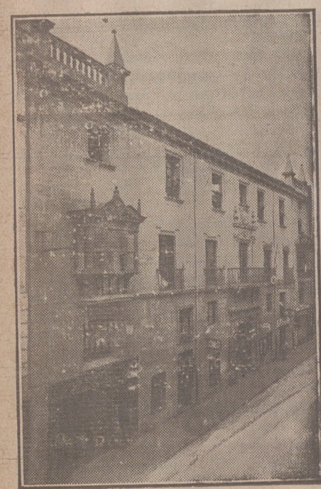
Fachada, por la calle de Santander, 10, 12 y 14, de la CASA SOCIAL propiedad de la Federación Burgalesa de Sindicatos Agrícolas Católicos.

En ella están las Oficinas de la FEDERACIÓN, CAJA DE AHORROS, MUTUALIDAD AGRÍCOLA BURGALESA y Redacción y Administración de «El Castellano» y «El Defensor de los Labradores»