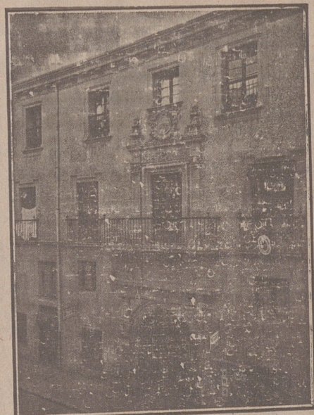
Entrada a las Oficinas de la Federación y MUTUALIDAD AGRÍCOLA BURGALESA. Calle de Santander, números 10, 12 y 14. Burgos.