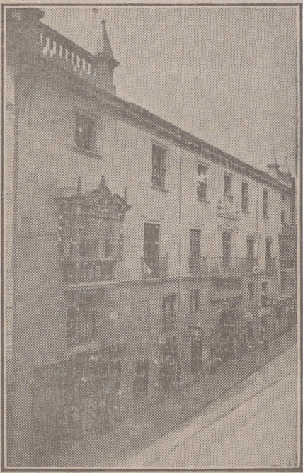
Fachada, por la calle de Santander, 10, 12 y 14, de la CASA SOCIAL propiedad de la Federación burgalesa de Sindicatos Agrícolas Católicos.

En ella están las Oficinas de la FEDERACIÓN, CAJA DE AHORROS, MUTUALIDAD AGRÍCOLA BURGALESA y Redacción y administración de «El Castellano» y «El Defensor de los Labradores».