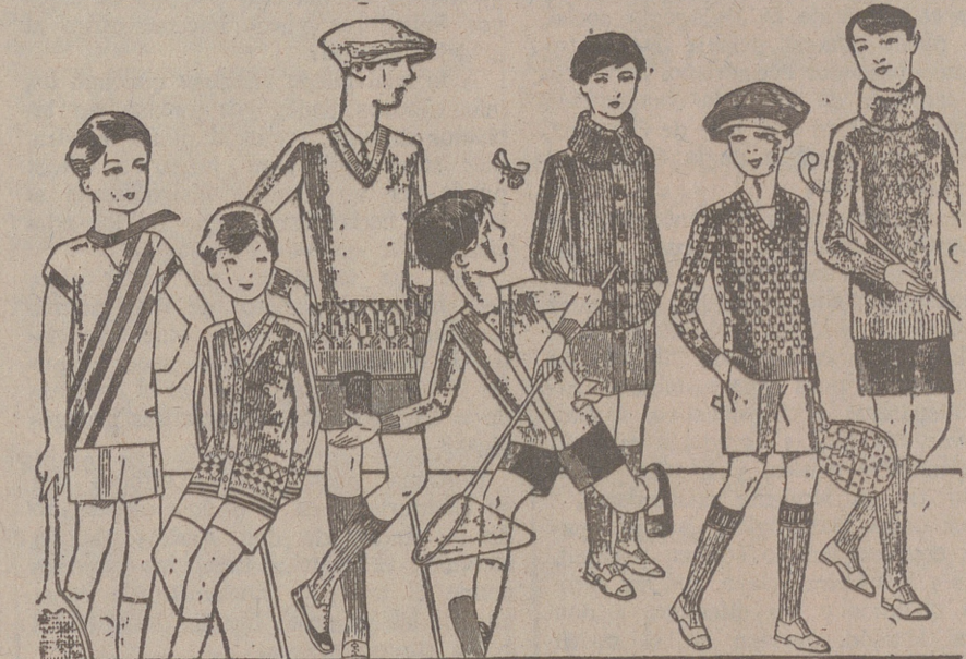
Jerseys para niños, dibujos novedad, desde 4, 4,50 5, 6, 7, 8, 10 y 12 ptas. Siempre gran surtido para elegir