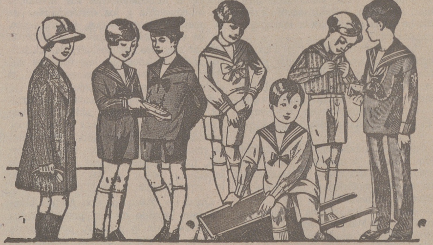
50 modelos distintos en trajes para niños en dril, en pana, en paño y en jergas azules, de 10 a 40 pesetas.

Primera casa en confecciones para caballero, señora, jóvenes y niños. — Tejidos, Pañería y Sastrefía.