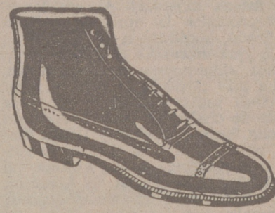
Botas clase 1.ª «Segarra», a 19'50. pesetas. Piel de hierro, a 19'50. Piel de hierro piso goma, a 18 ptas.