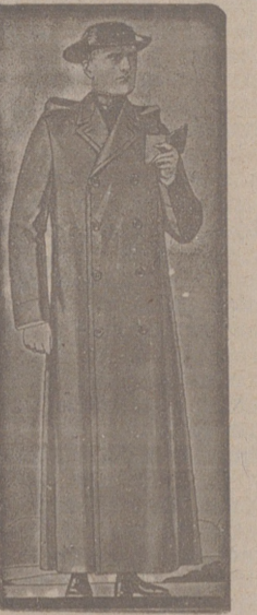
Impermeables, de 90, 100 y 115 ptas. Guardapolvos de dril forma dulleta, a 18, 20 y 50 ptas.