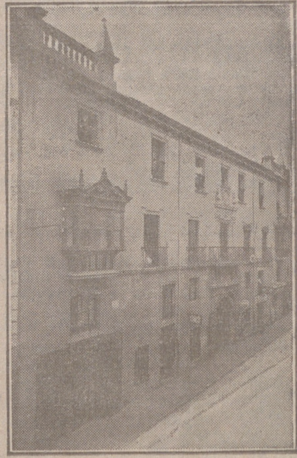
Fachada, por la calle de Santander, 10, 12 y 14, de la CASA SOCIAL propiedad de la Federación burgalesa de Sindicatos Agrícolas Católicos.

En ella están las Oficinas de la FEDERACIÓN, CAJA DE AHORROS, MUTUALIDAD AGRÍCOLA BURGALESA y Redacción y administración de «El Castellano» y «El Defensor de los Labradores».