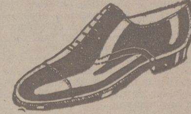
Zapatos piel de 1.ª, del 58 al 45, a 18 ptas. Zapato charol, a 19'50. LIMPIEZA GRATIS