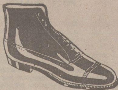
Botas clase 1.ª «Segarra», a 19'50, pesetas. Piel de hierro, a 19'50. Piel de hierro piso goma, a 18 ptas.