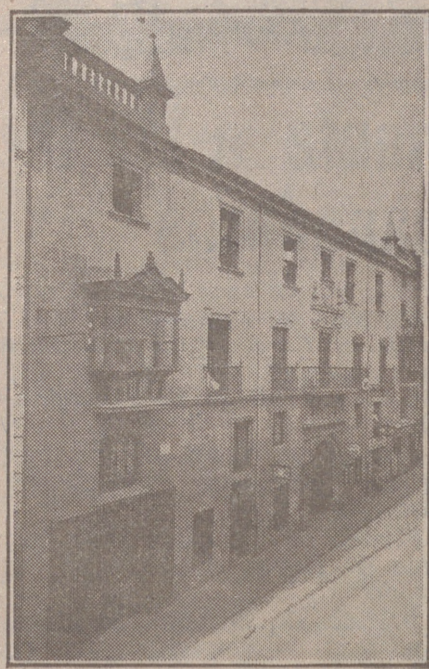
Fachada, por la calle de Santander, 10, 12 y 14, de la CASA SOCIAL propiedad de la Federación burgalesa de Sindicatos Agrícolas Católicos.

En ella están las Oficinas de la FEDERACIÓN, CAJA DE AHORROS, MUTUALIDAD AGRÍCOLA BURGALESA y Redacción y administración de «El Castellano» y «El Defensor de los Labradores».