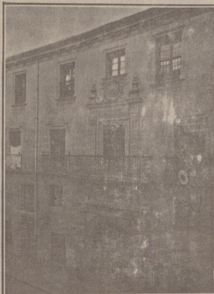
Entrada a las Oficinas de la Federación y MUTUALIDAD AGRÍCOLA BURGALESA Calle de Santander, números 10, 12 y 14 Burgos