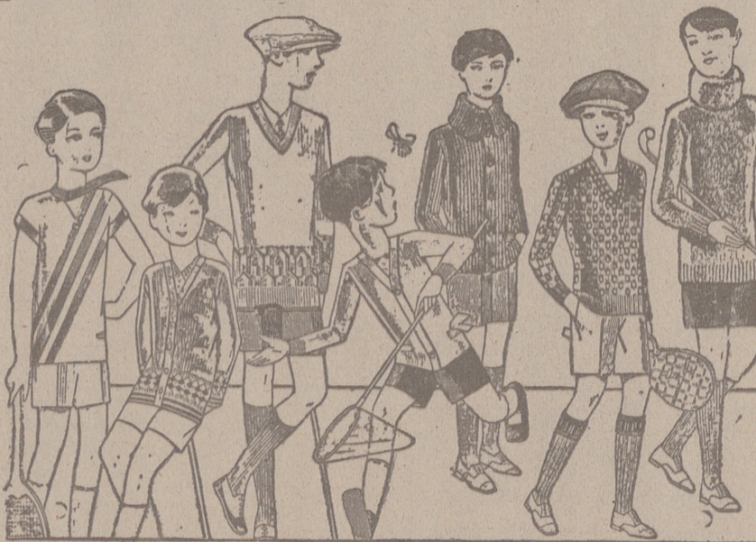
Jerseys para niños, dibujos novedad, desde 4, 4,50 5, 6, 7, 8, 10 y 12 ptas. Siempre gran surtido para elegir

USTED CONSEGUIRA TOMAR UN BUEN CAFE PIDIENDO EL DE ESTA MARCA: