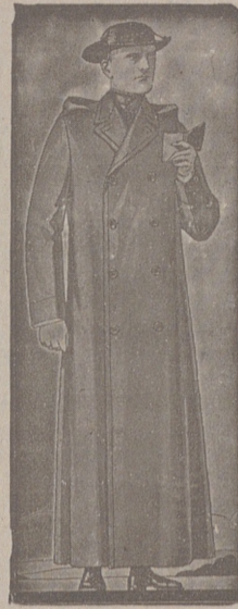
Impermeables, de 90, 100 y 115 ptas. Guardapolvos de dril forma dulteta, a 18, 20, 25 y 50 ptas.