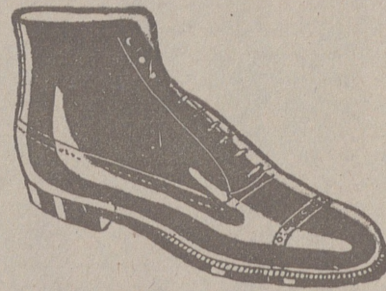
Botas clase 1. a «Segarra», a 19'50. pesetas. Piel de hierro, a 19'50. Piel de hierro piso goma, a 18 ptas.

Casa Manguía :: Plaza Mayor 42 y Lala Calvo 9 Sucursal: Plaza Mayor, 5 BURGOS Primera casa en confecciones para caballero, señora, jóvenes y niños. — Tejidos, Pañería y Sastrería. Sección de calzado Segarra