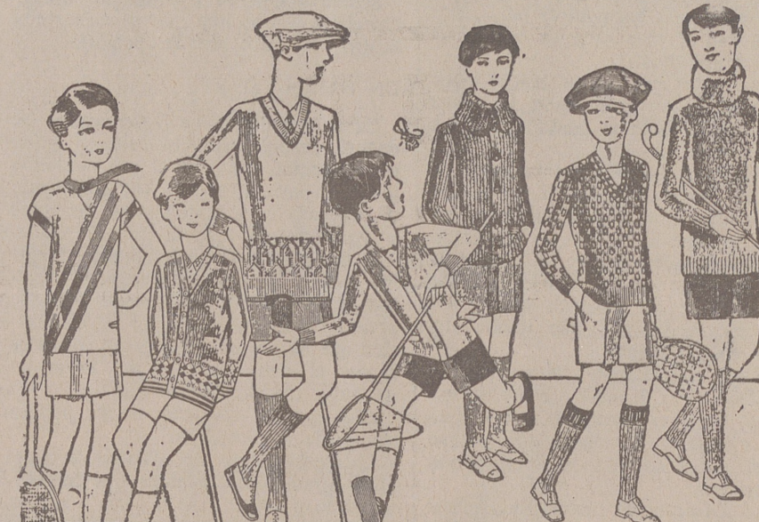
Jerseys para niños, dibujos novedad, desde 4, 4,50 5, 6, 7, 8, 10 y 12, pts. Siempre gran surtido para elegir