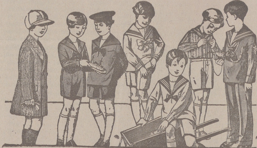
50 modelos distintos en trajectos para niños en dril, en pana, en paño y en jergas azules, de 10 a 40 pesetas.

Primera casa en confecciones para caballero, señora, jóvenes y niños. — Tejidos, Pañería y Sastrefía.