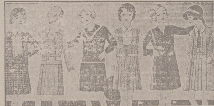
Vestidos para niñas, edad de 8 a 15 años, de crespones, lanas, batistas o percales, dibujos y colores novedad, a 6, 8, 10, 12 y 15 pesetas.