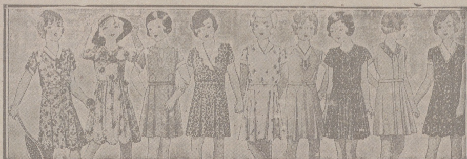
Vestidos de percal, batistas, crespones y lanas, edades de 4 a 8 años, a 5, 5,50, 4,75, 6, 7 y 8 ptas. Modelos novedad.

Primera casa en confecciones para caballero, señora, jóvenes y niños. — Tejidos, Pañería y Sastrería.