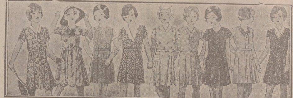
Vestidos de percal, batistas, crespones y lanas, edades de 4 a 8 años, a 5, 3,50, 4, 5, 6, 7 y 8 ptas. Modelos novedad.

Primera casa en confecciones para caballero, señora, jóvenes y niños. — Tejidos, Pañería y Sastrería.