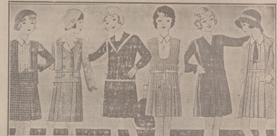
Vestidos para niñas, edad de 8 a 15 años, de crespones, lanas, batistas o percales, dibujos y colores novedad, a 6, 8, 10, 12 y 15 pesetas.