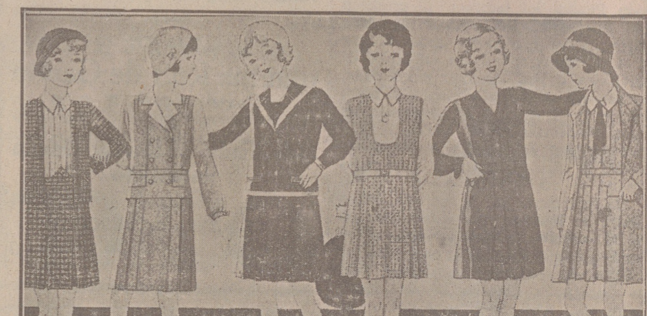
Vestidos para niñas, edad de 8 a 15 años, de crespones, lanas, batistas o percales, dibujos y colores novedad, a 6, 8, 10, 12 y 15 pesetas.