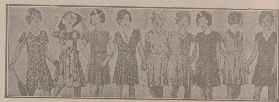
Vestidos de percal, batistas, crespones y lanas, edades de 4 a 8 años, a 5, 5,50, 4, 5, 6, 7 y 8 ptas. Modelos novedad.

Casa Munguía Plaza Mayor 42 y Laín Calvo 9 Sucursal: Plaza Mayor, 5 BURGOS Primera casa en confecciones para caballero, señora, jóvenes y niños. — Tejidos, Pañería y Sastrería.