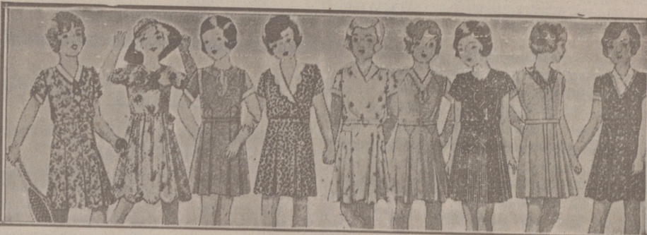
Vestiditos niñas edad de 5 a 10 años, en lana, crespón o punto a 10, 12, 15, 16, 18 y 20 pesetas.

FABRICA DE LIBROS RAYADOS, DIARIOS, MAYORES COPIADORES, ACTAS, ENCLADERNACIONES, ETC CAJAS DE CARTÓN EN GRAN ESCALA Gonzalo Hernando Manrique SUCESOR DE RUFINO S. GONZALO HUERTO DEL REY, 2, 4 y 6.—BURGOS