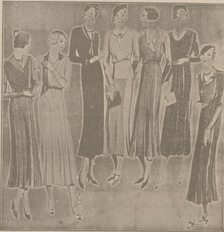
Vestidos de crepón y lana, modelos novedad, de 25, 50, 40, 50 y 60 pesetas.

Casa Munguía : Plaza Mayor, 42 y Lala Calvo 9 Sucursal: Plaza Mayor, 5 BURGOS Primera casa en confecciones para caballero, señora, jóvenes y niños. — Tejidos, Pañería y Sastrefía.