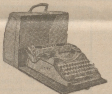
Máquinas de escribir Underwood, de viejo oficina. Reparación de toda clase de máquinas. Cambio o compra de máquinas.

Casa Munguía PLAZA MAYOR, 42 LAÍN CALVO 9 Y 11 BURGOS SECCION DE MAQUINAS