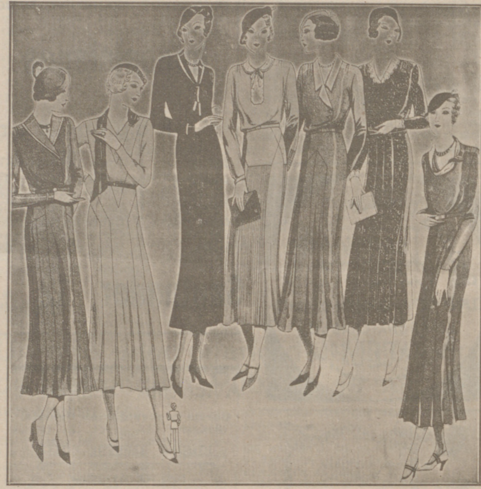
Vestidos de crespón y lana, modelos novedad, de 25, 50, 40, 50 y 60 pesetas.

Casa Munguía :: Plaza Mayor, 42 y Lain Calvo 9 Sucursal: Plaza Mayor, 5 BURGOS Primera casa en confecciones para caballero, señora, jóvenes y niños. — Tejidos, Pañería y Sastrería.