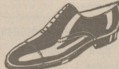
Zapatos todos los números, a 18 pesetas.-Charol, a 19'50.-Cosido todo.