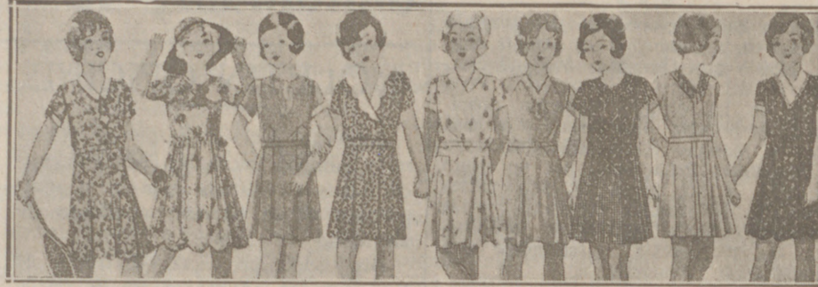
Vestiditos niñas edad de 5 a 10 años, en lana, crespón o punto a 10, 12, 15, 16, 18 y 20 pesetas.

La experiencia demuestra que los chocolates y dulces de MATIAS LOPEZ SON LOS MEJORES DEL MUNDO Perifoneo en todos los ultramarinos y confiterías