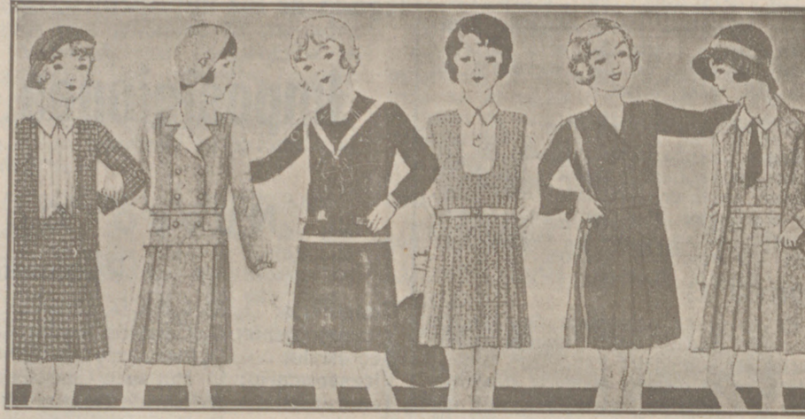
Vestiditos de lana, crespón seda y punto lana, edad de 8 a 14 años, a 14, 16, 18, 20 y 25 pesetas.

Casa Manguía :: Plaza Mayor, 42 y Lala Calvo 9 Sucursal: Plaza Mayor, 5 BURGOS Primera casa en confecciones para caballero, señora, jóvenes y niños. — Tejidos, Pañería y Sastrería.