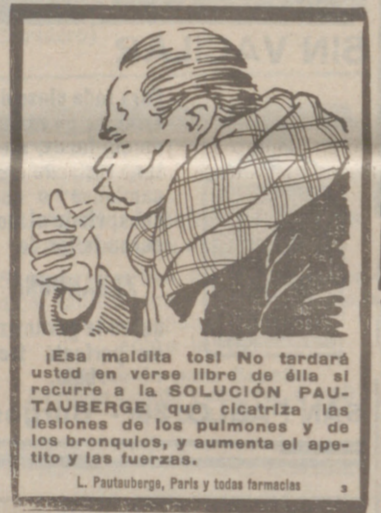
L. Paustrberg, París y todas farmacias

Medina 8.—El mitin comunista anunciado para el domingo en esta ciudad, hubo de suspenderse por no haberse podido celebrar.