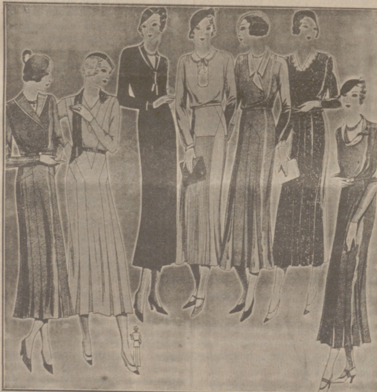
Vestidos de crepón y lana, modelos novedad, de 25, 30, 40, 50 y 60 pesetas.

Primera casa en confecciones para caballero, señora, jóvenes y niños. — Tejidos, Pañería y Sastrefía.