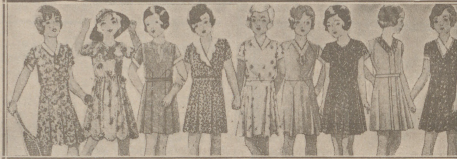
Vestiditos niñas edad de 5 a 10 años, en lana, crepón o punto a 10, 12, 15, 16, 18 y 20 pesetas.