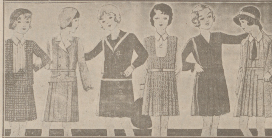
Vestiditos de lana, crepón seda y punto lana, edad de 8 a 14 años, a 14, 16, 18, 20 y 25 pesetas.

Primera casa en confecciones para caballero, señora, jóvenes y niños. — Tejidos, Pañería y Sastrería.