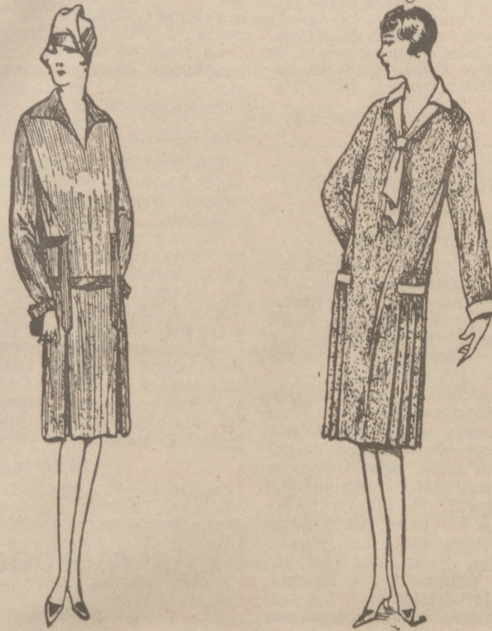
Vestidos de CRESPO o LANA de 18 a 35 pesetas. CORTE MODERNO Batas PERCAL, SATÉN NEGRO o CEFIRO desde 7 a 15 pesetas. MODELOS BONITOS